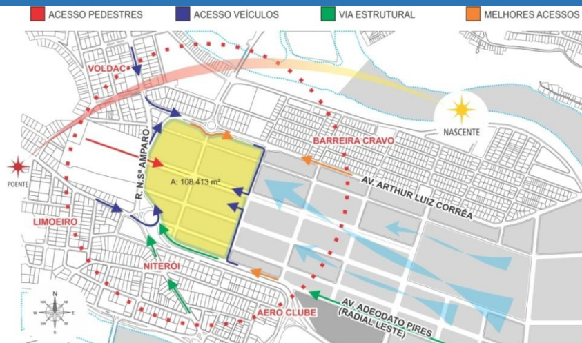
Figura 4: Croqui do terreno e seus acessos

Fonte: Desenho realizado por Rogério Rodrigues Ruhena