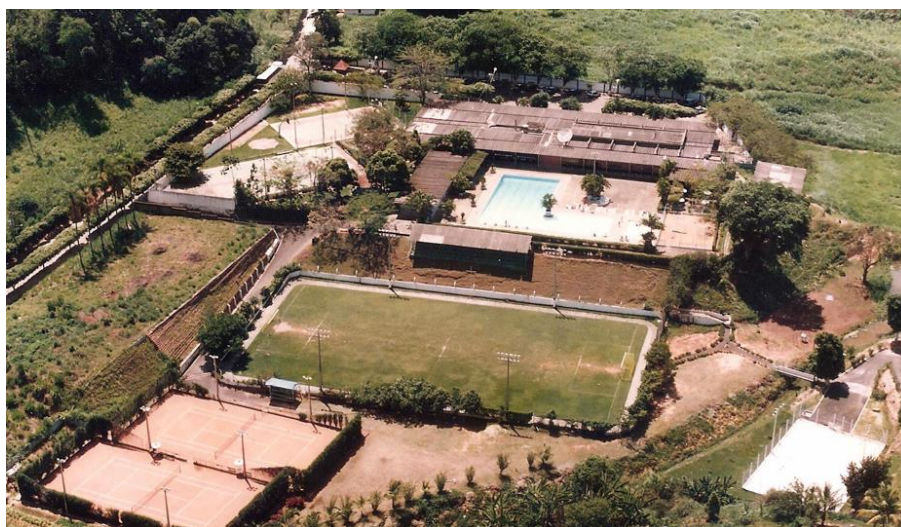
Figura 3: Vista Área do Clube do Moinho

É uma sociedade civil, sem fins lucrativos, políticos ou religiosos, sendo seu objetivo primordial oferecer a seus sócios, atividades recreativas, prática de esportes em diversas modalidades, competições esportivas entre clubes locais, nacionais e internacionais, proporcionando e mantendo ambientes de recreação, repouso e diversão, sendo regido pelas leis do País, Estatuto Social e Regimento Interno.