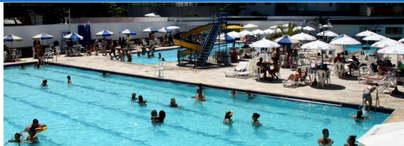
Figura 2: Vista das piscinas

O Clube Recreativo Mineiro conta com Ginásio poliesportivo - quadras de vôlei, peteca e Futsal -; Piscina semi-olímpica (Figura 2), piscina semi-olímpica aquecida, piscina e toboágua infantil, sauna masculina e feminina, salão de jogos, academia, área de playground, vestiário infantil, salão social com capacidade para 400 pessoas, quiosques com churrasqueira e varandão.