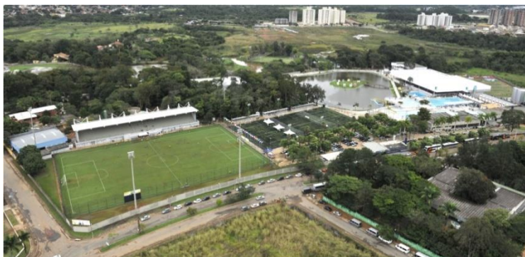
Figura 1: Vista aérea do Sesi Clube

Academia, campo de futebol, campo de futebol society, ginásios e quadras poliesportivos, parque aquático, quadra de areia, quadra de tênis e saunas.