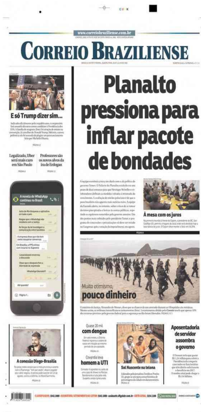
Figura 3. Manchete