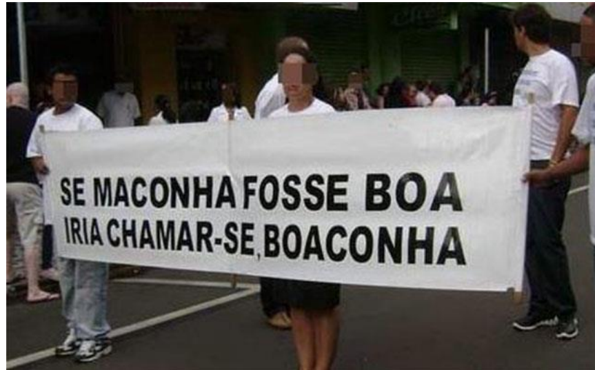
Figura 2: Manifestação