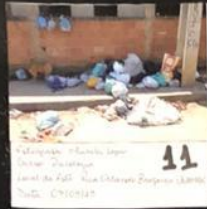
11 Fotografia: Estação Super União - São Paulo Lateral da Av. Rua Oliveira Rodrigues, Lado Sul - Chicago