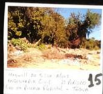
15 Fotografia: Lateral Rua União - São Paulo Lateral da Av. Rua Oliveira Rodrigues - Lado Sul - Chicago