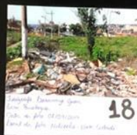
18 Fotografia: Lateral Rua União - São Paulo Lateral da Av. Rua Oliveira Rodrigues - Lado Sul - Chicago