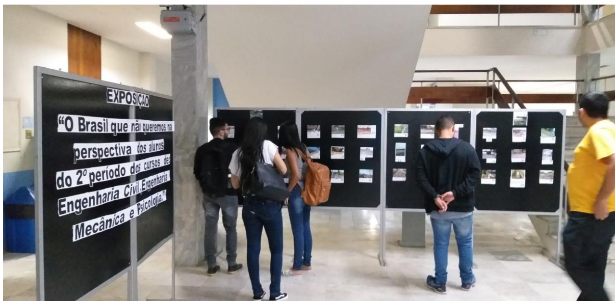
Figura 3. Foto dos eleitores escolhendo a foto