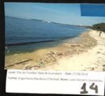
14 Lateral da Av. Rua União - São Paulo Lateral da Av. Rua Oliveira Rodrigues - Lado Sul - Chicago