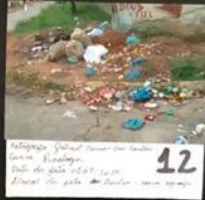
12 Fotografia: Lateral Rua União - São Paulo Lateral da Av. Rua Oliveira Rodrigues - Lado Sul - Chicago