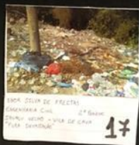
17 Fotografia: Lateral Rua União - São Paulo Lateral da Av. Rua Oliveira Rodrigues - Lado Sul - Chicago