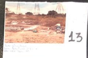
13 Fotografia: Lateral Rua União - São Paulo Lateral da Av. Rua Oliveira Rodrigues - Lado Sul - Chicago