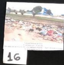
16 Fotografia: Lateral Rua União - São Paulo Lateral da Av. Rua Oliveira Rodrigues - Lado Sul - Chicago