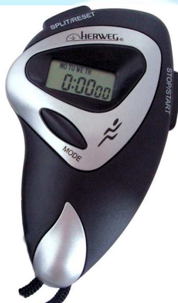
Fig. 9 – Cronômetro

Para execução do exercício foram necessários os seguintes materiais pedagógicos de apoio, como Cronômetro (figura 9), Folha de atividades (figura 10) e Folha de cronometragem (figura 11).