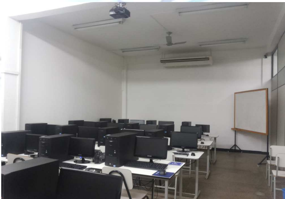
Fig. 8 – Laboratório de Informática III da UGB.

Para desenvolver esse exercício prático foram utilizados os computadores do laboratório de informática III.