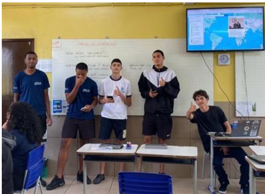
Apresentação da turma 2002. Colégio Rio Grande do Norte, 21/08/2025.