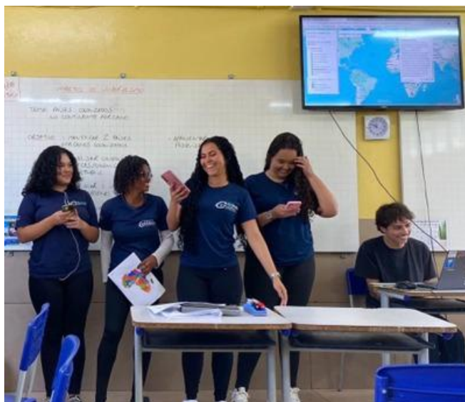
Alunos da turma 2002 apresentando o trabalho com a televisão da instituição. Colégio Rio Grande do Norte, 21/08/2025.