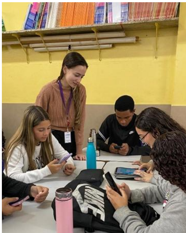
Alunos da turma 2004 pesquisando o trabalho utilizando o tablet da instituição. Colégio Rio Grande do Norte, 21/08/2025.