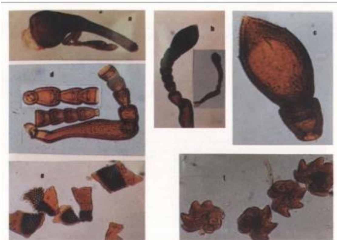
Figura 2. Sitophilus spp. Adulto. (a) Cabeça, (b) antena, (c) antenômero apical, (d) antenômeros, (e) fragmentos dos olhos compostos, (f) mandíbulas esquerda e direita. (Fonte: VARGAS, 1996)

Essa característica da espécie em ser grande e com cerdas distribuídas pelo corpo facilita, portanto, a interação com agentes patológicos, transmitindo-os por onde passar. Ou seja, torna-o um vetor importante. Além disso, segundo Vargas (1996), fragmentos de insetos também podem ser contaminantes e o grau de integridade do mesmo sugere a fase da contaminação. A imagem abaixo demonstra alguns dos fragmentos encontrados por Vargas em processos de identificação de insetos infestantes de alimentos.