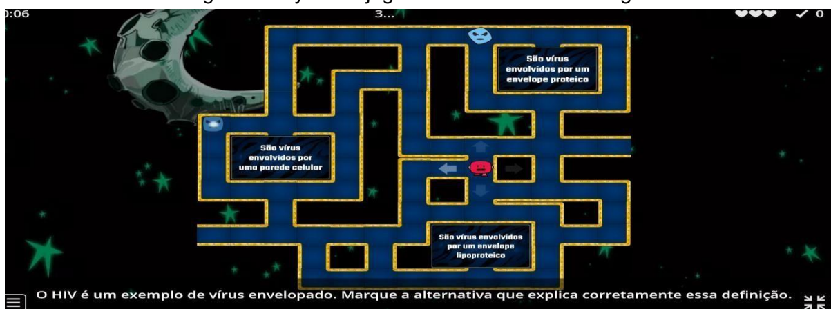
Figura 1. Layout do jogo “Labirinto da Microbiologia”.

O jogo Labirinto da microbiologia foi criado para auxiliar professores que encontram com dificuldade para prender e cativar a atenção dos alunos em sala de aula, com intuito de melhorar o processo de ensino-aprendizagem. O jogo conta com perguntas sobre a microbiologia aplicada ao dia a dia e, também, com perguntas como morfologia e estrutura de microrganismos, contendo 20 questões a respeito de bactérias e vírus. O jogo simula um labirinto e o aluno deverá conduzir o avatar, em vermelho (Figura 1) até a resposta correta da pergunta previamente feita, desviando dos avatares em azul.