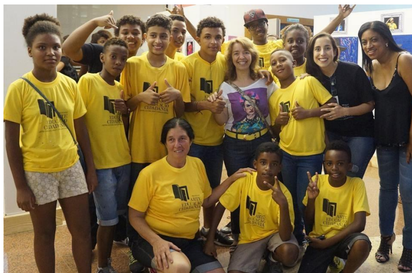
Imagem 13: Alunos com as professoras e a diretora da Escola Municipal Professor Arlindo Rodrigues no dia da inauguração da exposição

Nesse sentido, depois de relatar todo o processo de prática pedagógica desenvolvido, concluo ressaltando a essência principal deste trabalho que é acreditar na arte e na educação como elementos de transformação e no olhar como prática fundamental do processo de relação interpessoal e de construção artística. É preciso olhar para o outro e se olhar, respeitando as diferenças. Nas palavras do mestre Paulo Freire: “Educação não transforma o mundo. Educação muda as pessoas. Pessoas transformam o mundo”.