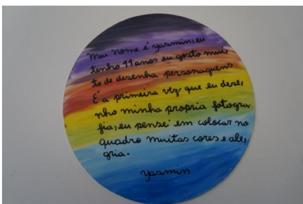
Imagem 9: Mandala feita pela aluna Yasmin

7º. Produção de um texto sobre o quadro e elaboração de uma mandala ilustrativa com base no texto.