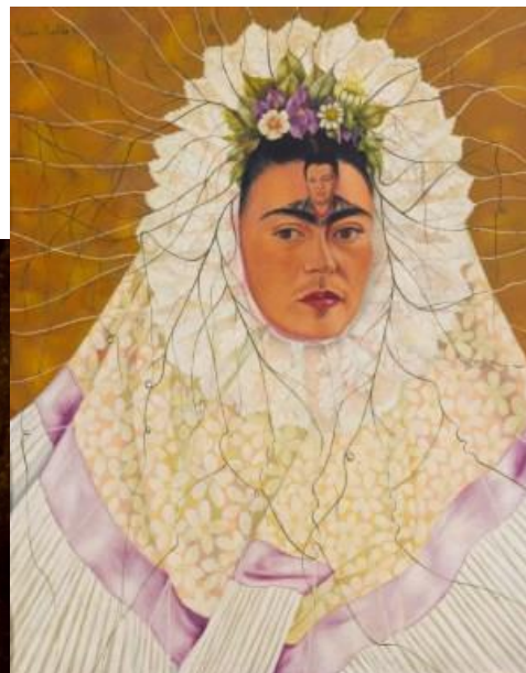
Imagem 4:Autorretrato “Diego em meu pensamento”1943