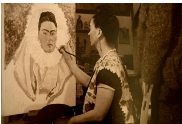
Imagem 3:Frida se pintando

3º. Apresentação de uma pesquisa de imagens de Frida Kahlo,tanto fotografias da artista em diferentes momentos a sua vida quanto imagens de seus quadros.O foco foi a associação da imagem de Frida com seus autorretratos.