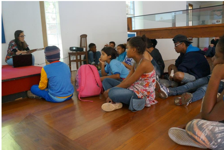
Imagem 2:Contação de Histórias com os alunos

3º. Apresentação de uma pesquisa de imagens de Frida Kahlo,tanto fotografias da artista em diferentes momentos a sua vida quanto imagens de seus quadros.O foco foi a associação da imagem de Frida com seus autorretratos.