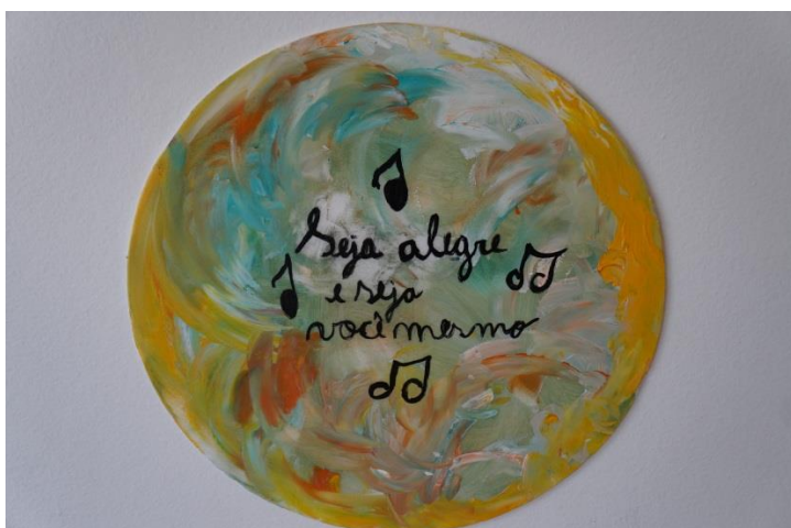
Imagem 10: Mandala feita pelo aluno Pedro