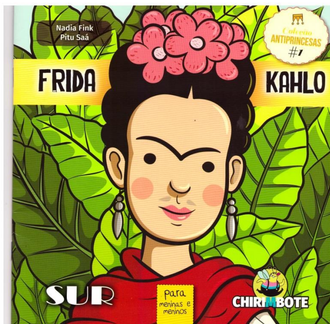
Imagem 1: Capa do livro infantil utilizado no projeto